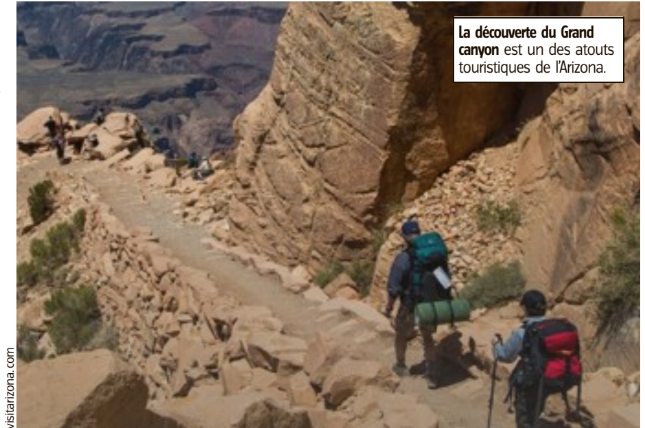
La découverte du Grand canyon est un des atouts touristiques de l'Arizona.

Et puis, en même temps que l'élection présidentielle, « il y a l'élection sénatoriale, et elle est importante, parce que la majorité au Sénat et le contrôle du pouvoir exécutif par le législatif dépendra peut-être du résultat en Arizona ».